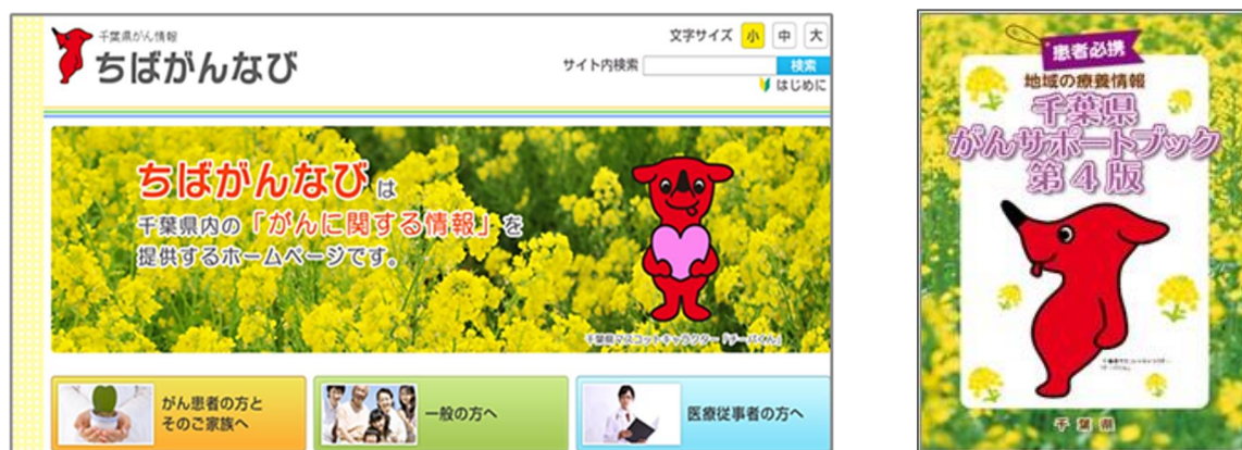
図表4-3-2: 「千葉県がん情報 ちばがんナビ」と「地域の療養情報 千葉県がんサポートブック」

しかし、令和5年7月に県が一般県民を対象に実施した「医療に関する県民意識調査」では、ちばがんナビを「知らない」と答えた割合は89.9%、「知っているが利用したことはない」は8.3%、「知っており利用している」は1.8%でした。