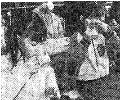
③ちょっと臭うのかな？