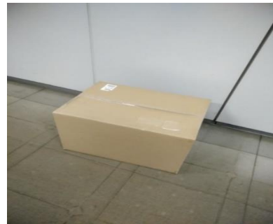
梱包段ボール写真