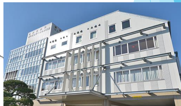
旭神経内科リハビリテーション病院