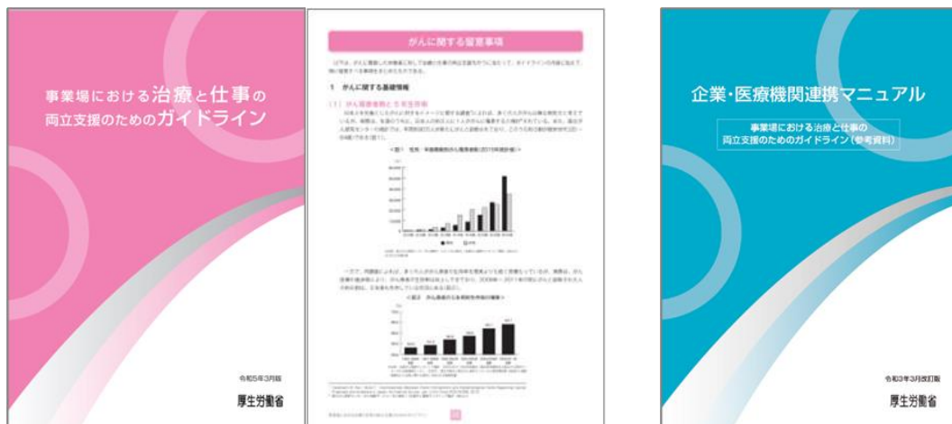
図表4-3-5:「事業場における治療と仕事の両立支援のためのガイドライン」、「企業・医療機関連携マニュアル」

また、拠点病院等のがん相談支援センターでは、がんを抱える従業員の働き方に関する事業者・企業の人事労務担当者からの相談や、事業者・企業と担当医との間の調整も行っています。