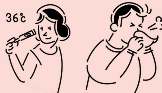
無症状・軽症者からの感染も