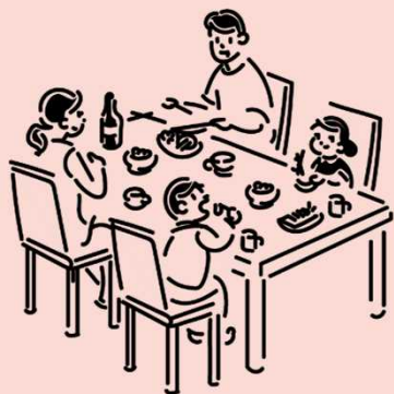
主な感染経路は「家庭内」や「会食」