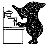
千葉県マスコット キャラクター チーバくん