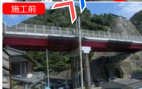
一般国道128号 勝浦市大沢（大沢1号橋）