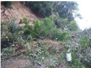
法面崩落で約1カ月間の全面通行止め