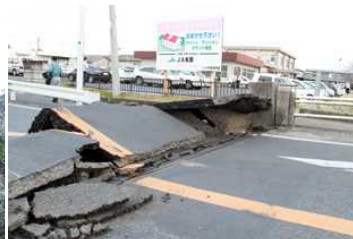
橋と道路の接続部が破損し通行規制