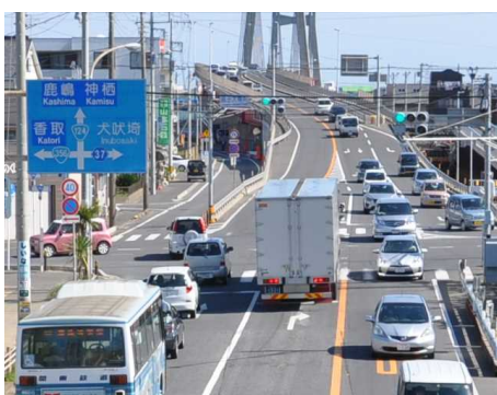
整備後の交差点状況