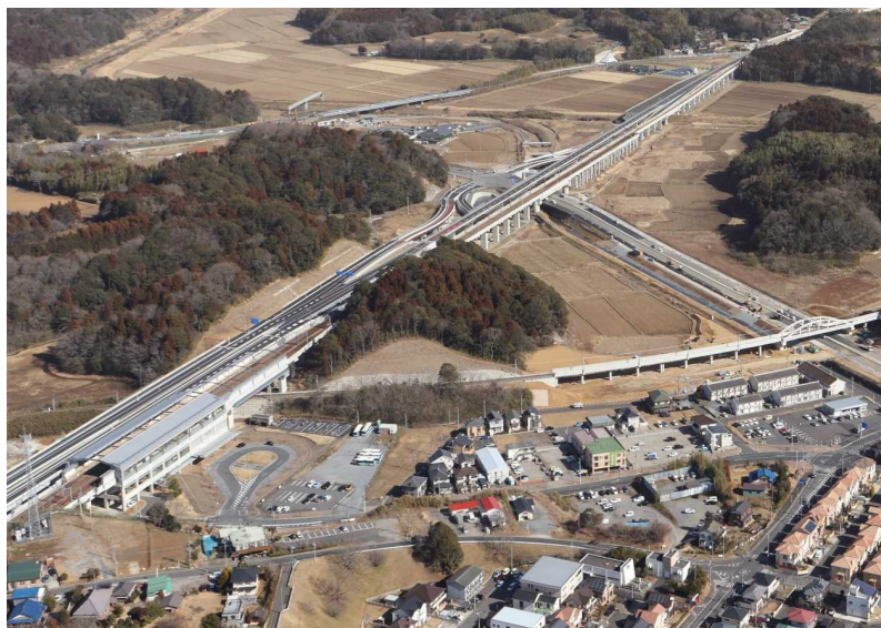
一般国道464号北千葉道路 (成田市船形～押畑間約3.8km開通:平成31年3月3日)