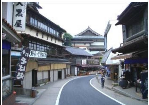
門前町の町並み（成田市）

NPO法人 久留里フィールドミュージアム（君津市） 柏の葉アーバンデザインセンター（柏市） 幕張新都心まちづくり協議会（千葉市） 仲町街づくり協議会（成田市） 上町街づくり協議会（成田市） 花一参道街づくり協議会（成田市） 花崎町街づくり研究会（成田市） NPO法人 KAO（カオ）の会（鎌ヶ谷市） 我孫子の景観を育てる会（我孫子市） 海・まち・デザイン（浦安市） 行徳グリーン・クリンの会（市川市） 下田の杜里山協議会（柏市） うらやす景観まちづくりフォーラム（浦安市）