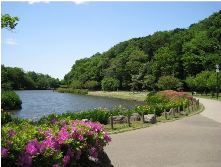
じゅん菜池緑地（市川市）

都市緑地法に基づき、民間の建築物の屋上、空地など敷地内を緑化する計画について市町村長の認定を受けることができる制度です。