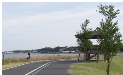
手賀沼自然ふれあい緑道