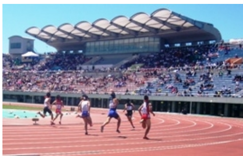
千葉県総合スポーツセンター

文化とコミュニティをテーマとし、自然の地形を生かすとともに、樹林地を極力残した北総地域の中核的な都市公園として、平成6年度から旧住宅・都市整備公団（現・独立行政法人都市再生機構）が整備を進め、県が引き継ぎました。平成12年度から供用を開始し、現在は、36.1haを供用しています。