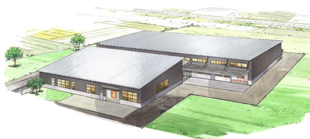
市原高等技術専門校新総合実習棟 外観完成イメージ