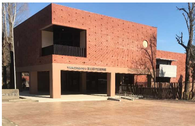
県立房総のむら風土記の丘資料館 大規模改修工事

令和3年度は、県立房総のむら風土記の丘資料館の大規模改修工事、東葛飾合同庁舎の改修工事(計画保全)などを実施しました。