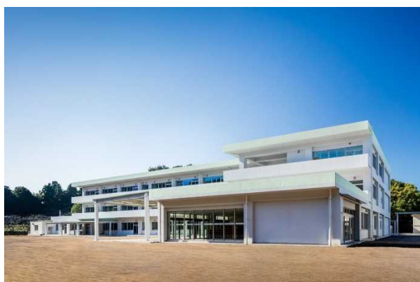
(仮称)千葉県立東葛飾地区特別支援学校 竣工写真

令和3年度は、(仮称)千葉県立東葛飾地区特別支援学校校舎外建築工事などが完成したほか、市原高等技術専門校新総合実習棟建築工事などに着手しました。