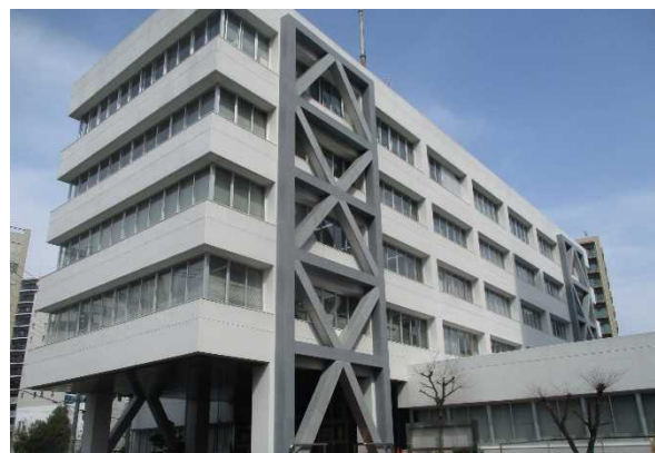
東葛飾合同庁舎改修工事(計画保全)