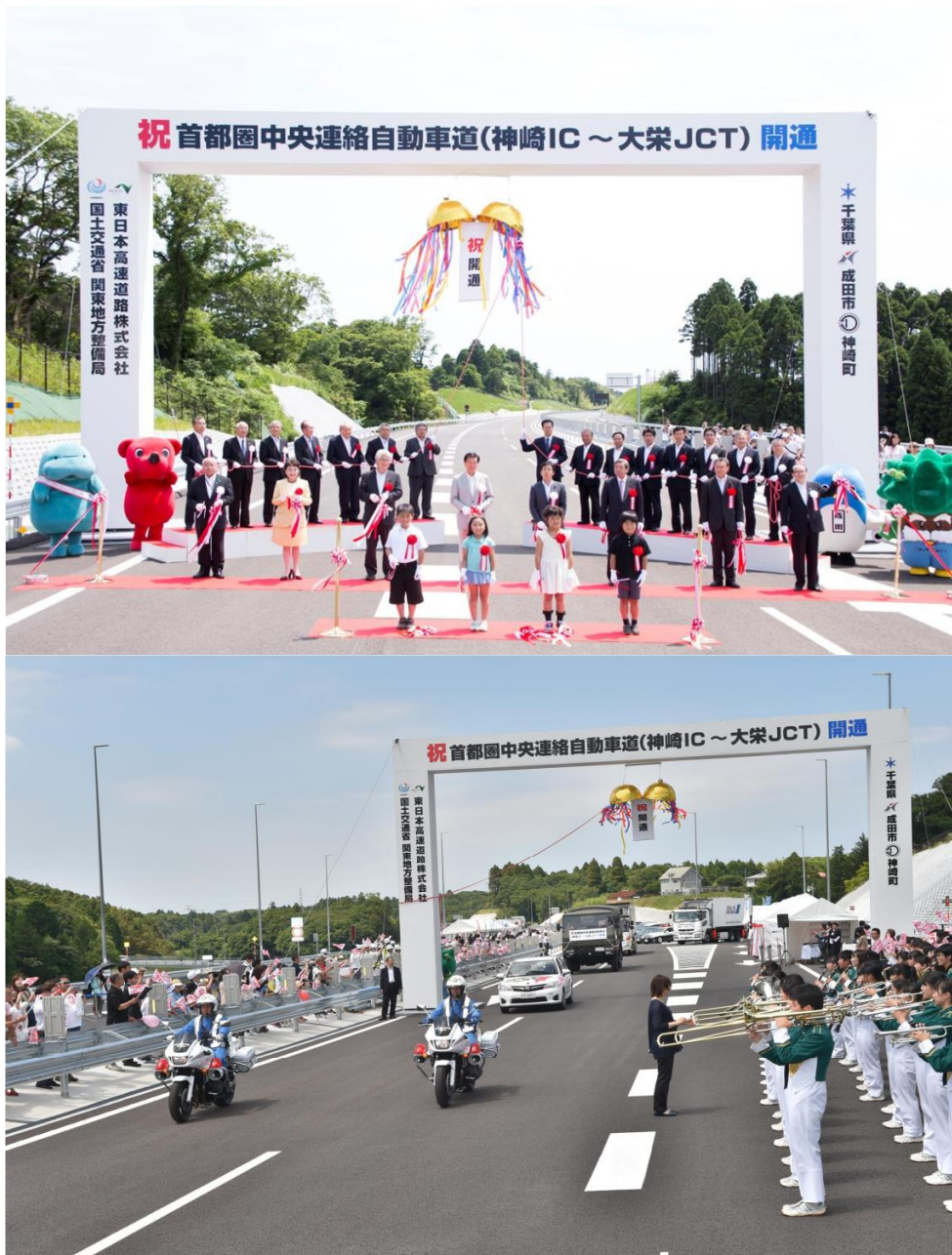
首都圏中央連絡自動車道(神崎IC~大栄JCT)開通式 (平成27年6月7日)