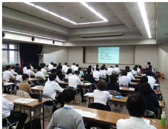
土木技術職員研修

特に、若手職員については、“即戦力”として活躍が求められていることから、採用後、3年間で必要な知識、知見、技術が習得できるよう努めております。