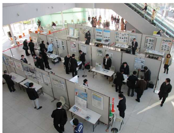
ちば千産技術展示会

特に、県内企業が開発した新技術については、「ちば千産技術」として、発表会、展示会及びホームページへの掲載等により、広く情報発信しています。