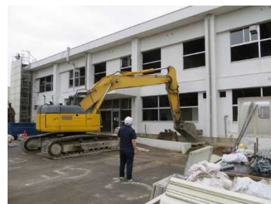
解体工事現場へのパトロール