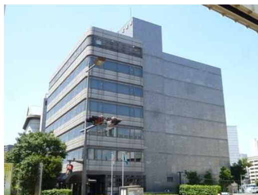
千葉県文書館（外壁改修）