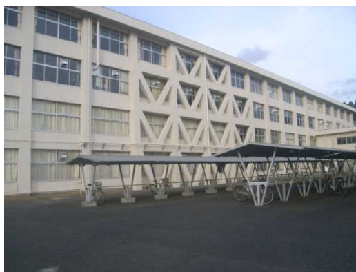
多古高等学校特別教室棟（耐震改修）

平成25年度は、耐震改修工事として県立多古高等学校特別教室棟、改修工事として千葉県文書館外壁改修等の改修を行いました。