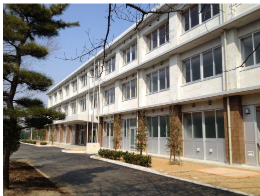
千葉県立国分高等学校校舎（管理棟外） 建築工事

平成25年度には、県立国分高等学校管理棟、県立野田特別支援学校教室棟等が完成しました。