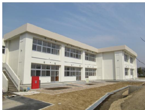
千葉県立野田特別支援学校校舎（仮称） 教室棟増築工事