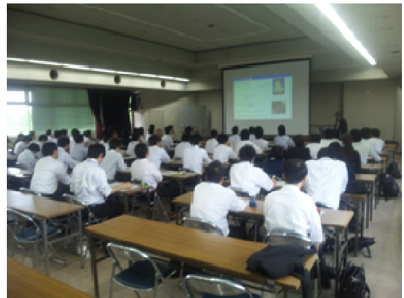
土木技術職員研修

このような情勢の中で、土木技術職員が職務に必要な知識や技術力の向上を図るため、各種の研修等を実施しています。