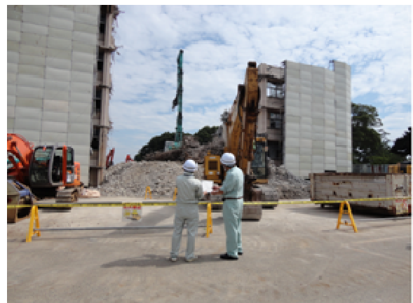
解体工事現場へのパトロール

県では、建設リサイクル法に基づくパトロールを実施し、法の実効性の確保に努めています。