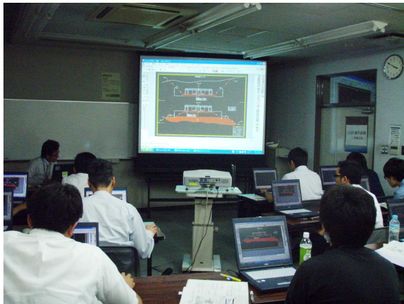
職員を対象としたCAD研修

電子納品とは、調査、設計、工事などの各業務段階の最終成果を電子データで納品することをいいます。県土整備部では平成15年度から委託業務を、平成16年度から工事において電子納品の試行を始め、平成19年度から全面的に実施しています。