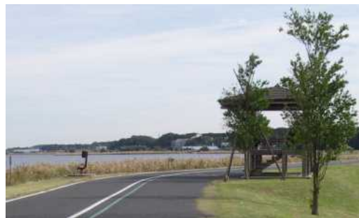
手賀沼自然ふれあい緑道