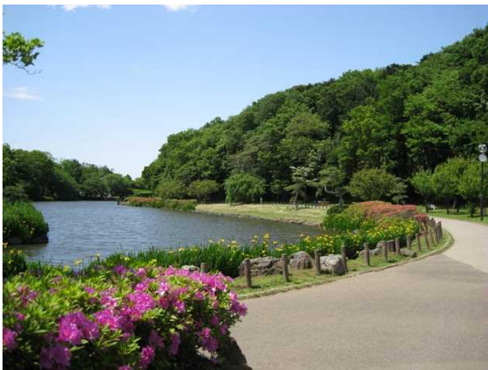
じゅん菜池緑地(市川市)

また、このほか16市で各市の条例により、保存樹2,843本、保存樹林1,583箇所6,274,211㎡が指定されています。