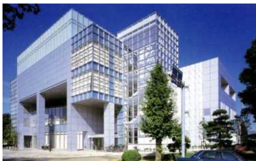
千葉県スポーツセンター

文化とコミュニティをテーマとし、自然の地形を生かすとともに、樹林地を極力残した北総地域の中核的な都市公園として、平成6年度から旧住宅・都市整備公団（現・独立行政法人都市再生機構）が整備を進め、県が引き継ぎました。平成12年度から供用を開始し、現在は、36.1haを供用しています。