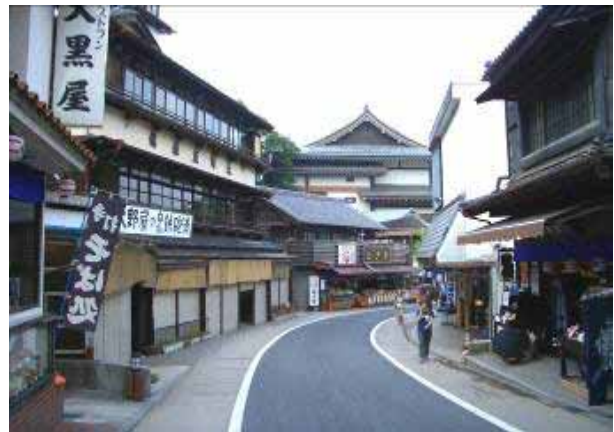
門前町の町並み（成田市）

NPO法人 久留里フィールドミュージアム（君津市） 柏の葉アーバンデザインセンター（柏市） 幕張新都心まちづくり協議会（千葉市） 仲町街づくり協議会（成田市） 上町街づくり協議会（成田市） 花一参道街づくり協議会（成田市） 花崎町街づくり研究会（成田市） NPO法人 KAO(カオ)の会（鎌ヶ谷市） 我孫子の景観を育てる会（我孫子市） 海・まち・デザイン（浦安市）