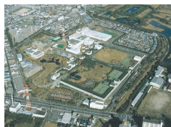
江戸川第二終末処理場