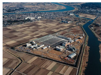
手賀沼終末処理場

令和5年3月末においては、1日平均約21万 \text{m}^3 を処理する水処理施設が稼働しています。