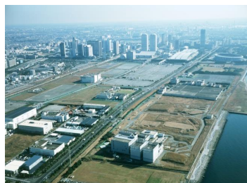
花見川第二終末処理場