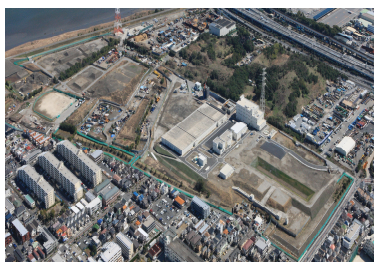
江戸川第一終末処理場

令和5年3月末においては、江戸川第二終末処理場で1日平均約36万 \text{m}^3 、江戸川第一終末処理場で1日平均約2万 \text{m}^3 を処理する水処理施設が稼働しています。