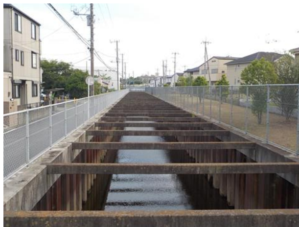
寺崎都市下水路（佐倉市）

公共下水道は、下水（雨水及び汚水）を道路等の地下に埋設した下水管で排除し、汚水は末端に設置した終末処理場、または終末処理場を有する流域下水道に接続し、処理するものです。千葉県では令和5年3月末においては、36市町村で実施（うち1町では雨水排除のみ実施）されています。