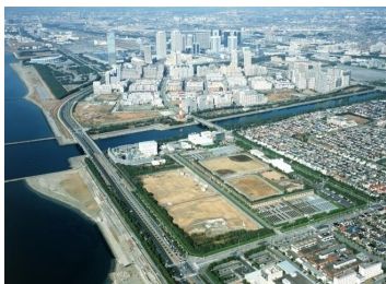
花見川終末処理場

令和5年3月末においては、花見川終末処理場は1日平均約31万 \text{m}^3 、花見川第二終末処理場は、1日平均約22万 \text{m}^3 を処理する水処理施設が稼働しています。