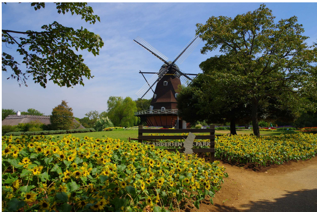
アンデルセン公園(船橋市)

都市緑地法に基づき、民間の建築物の屋上、空地など敷地内を緑化する計画について市町村長の認定を受けることができる制度です。