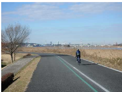
手賀沼自然ふれあい緑道

令和4年4月1日現在、3.7haを供用しており、その他の施設についても整備を進めています。