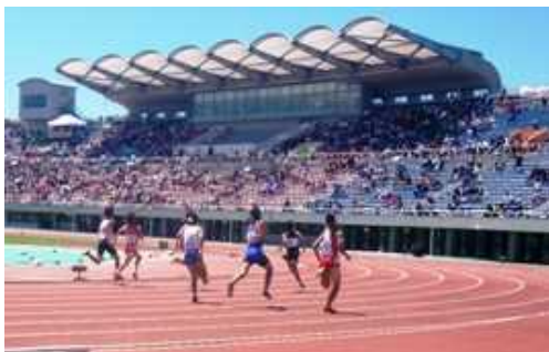
千葉県総合スポーツセンター

文化とコミュニティをテーマとし、自然の地形を生かすとともに、樹林地を極力残した北総地域の中核的な都市公園として、平成6年度から旧住宅・都市整備公団（現・独立行政法人都市再生機構）が整備を進め、県が引き継ぎました。平成12年度から供用を開始し、現在は、36.1haを供用しています。