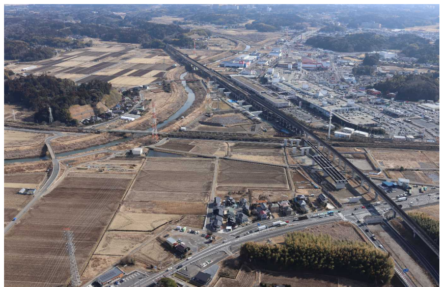
一般国道464号北千葉道路 - 成田市押畑 より成田空港方面