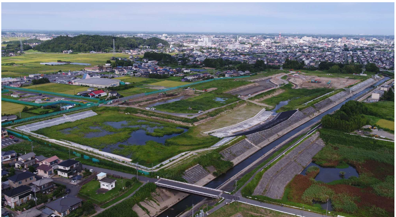
一宮川第二調節池増設(茂原市上茂原地先)8月下旬暫定供用開始