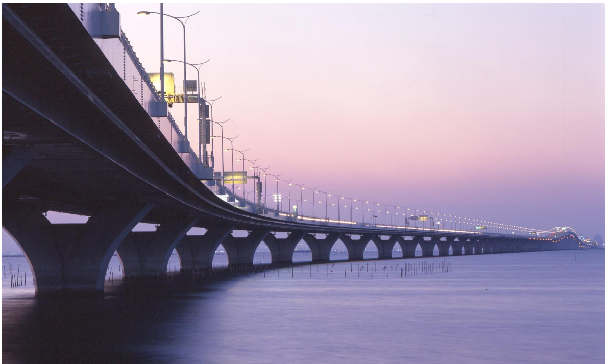
↑ 東京湾アクアライン上り線(木更津→川崎方面)7月下旬ETC時間帯別料金社会実験開始