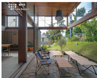
住宅の部 優秀賞 形高の家