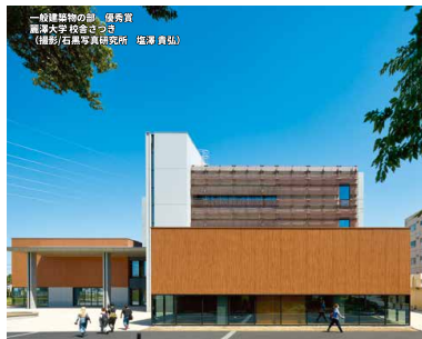
一般建築物の部 優秀賞 藤本大学 総合ホール