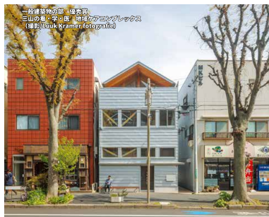
一般建築物の部 優秀賞 三山の家 宇田屋 建築工房の3Dパノラマ