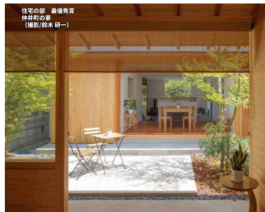
住宅の部 最優秀賞 所井野の家