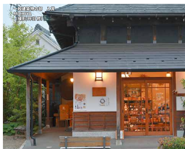
一般建築物の部 入賞 刈田橋 住友不動産武蔵