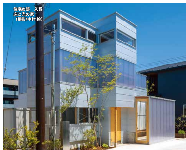
住宅の部 入賞 床と光の家