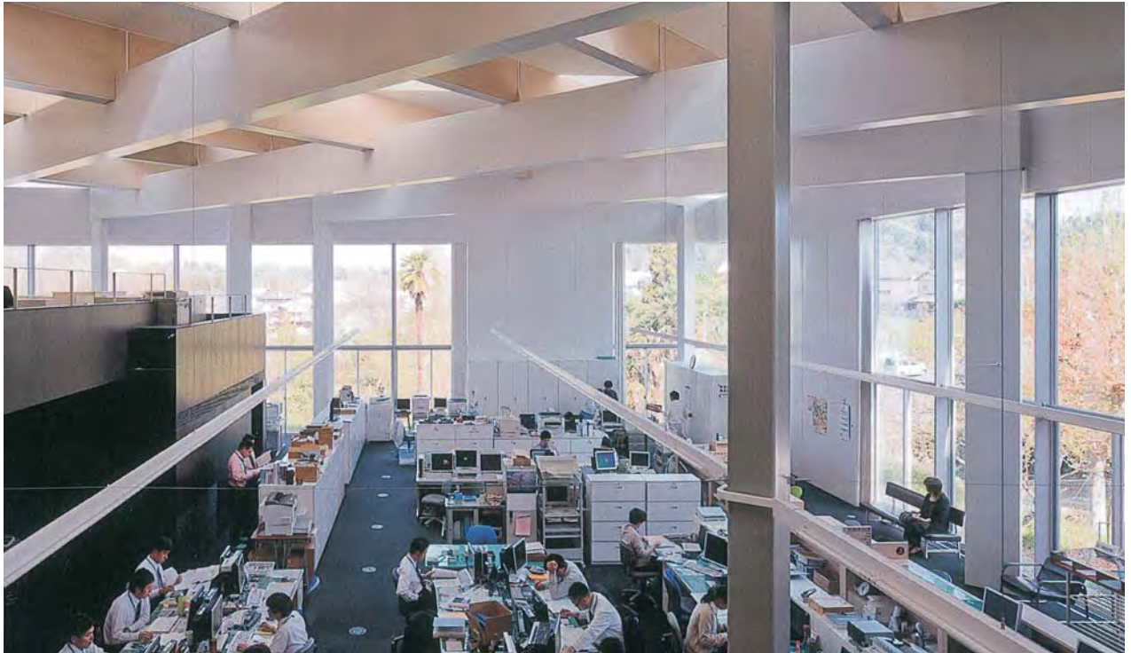
増築棟 内観 2階から東方向を見る