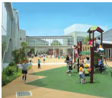
子どもたちの生き生きとした活動の舞台となるスクールプラザ

3.11以降顕在化した避難施設としての学校建築のあり方を先取りし、モデル的な施設構成や技術的対応がなされていることも評価されるべきである。今後、地域の人口の増加と共に児童数が増え、定常的な熟成を迎えた状況を見てみたい、そんな秀逸な小学校である。(岩村 和夫)