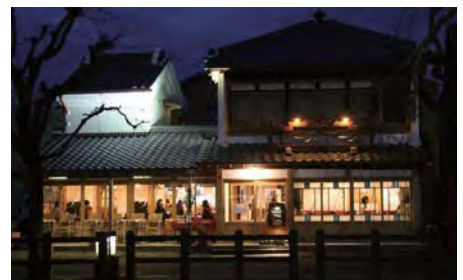
小野川沿いのガス燈風照明と調和し、柔らかな雰囲気包まれる。