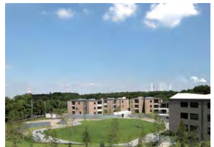
都市的に快適に暮らす環境と雑木林との融合を図った、谷津のシステムを取り入れた全体計画