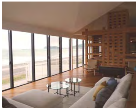
2階リビングより木造立体格子と館山の海を望む