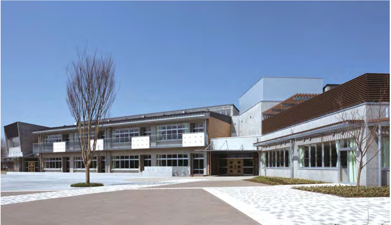
住宅地のスケールに合わせ連続する壁面を分節することで周囲への圧迫感を軽減した落ち着いた外観

近年、環境に配慮した建築の枕詞は「低炭素」あるいは「ゼロエミッション」に集約され、本来のサステイナブルな建築が目指していた、環境・社会・経済を統合する総合性が失われつつある。そして、建築を取り巻く周辺との関係性について熟慮した事例は少ない。柏市立柏の葉小学校は、そんな傾向の中にあって、「国際キャンパスタウン」を標榜する新たなまちづくりの先導プロジェクトとして位置付けられた。つまり、当初からその総合性が求められる条件が整っており、公立の学校建築として優等生的な答えが資料に垣間見られる。しかし、上位組織にあたるアーバンデザインセンター等とのやりとりに誠実に、そして創造的に対応した跡が随所に発見できることを高く評価したい。