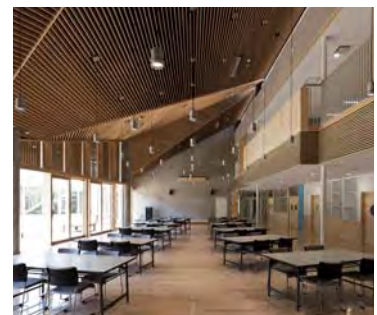
スクールプラザと連続した明るく開放的な木の温もりある多目的ホール