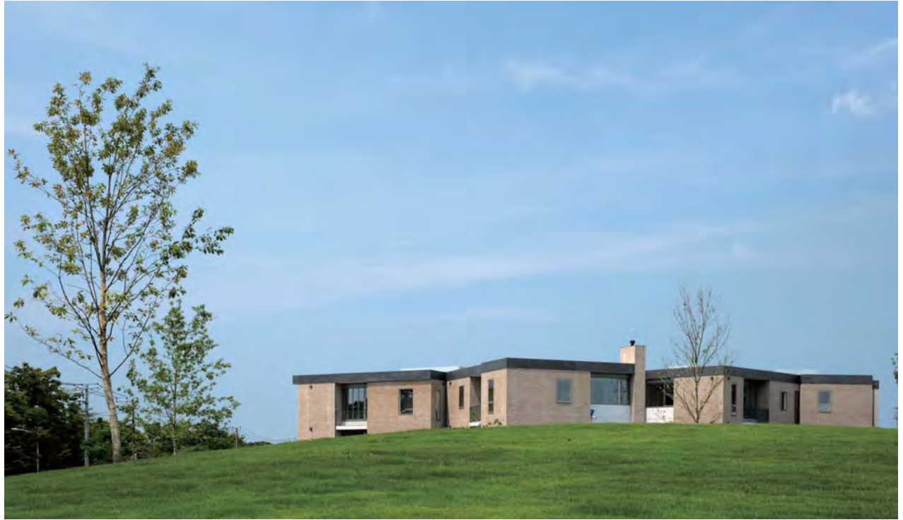
豊かに醸成していく雑木林(緑)と共生する環境を生活の中で育てていくプログラム(緑の丘東側から)