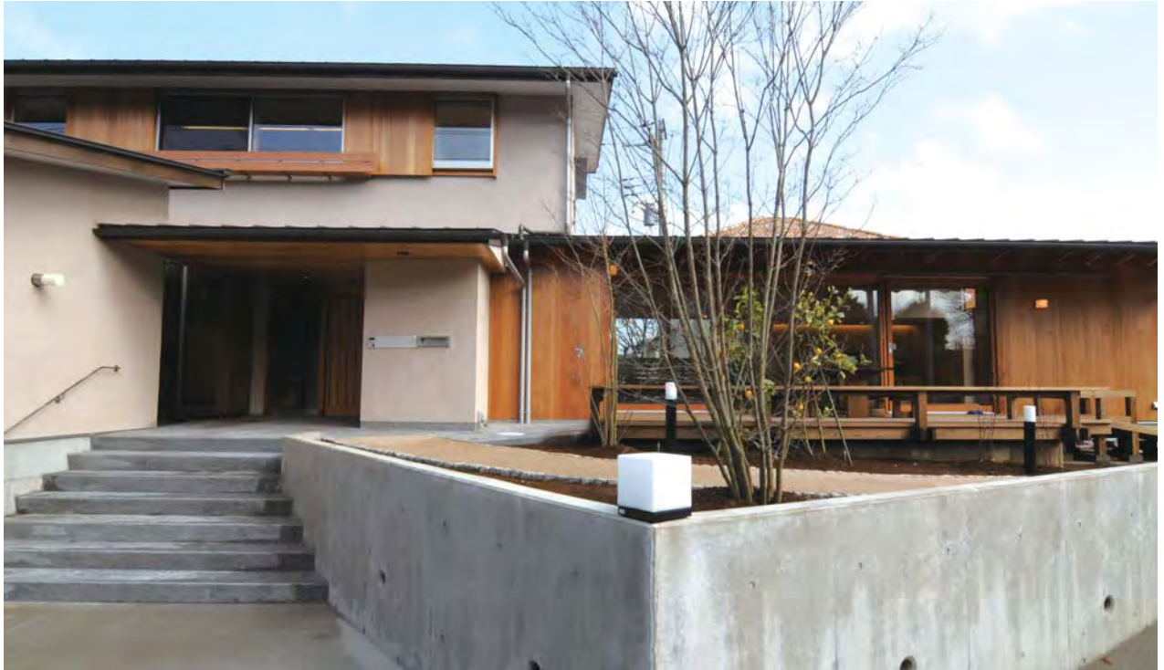
建物のプロポーションを低く抑えることで威圧感のない街並みになじむ外観デザインにしている。

多くの人は「最期を我が家で」と望むが、その8割近くは病院で亡くなるのが現状。その中「がんと診断されても、入院せずに治療を継続し、最期まで住み慣れた自宅での暮らしを続けられるように」、さくさべ坂通り診療所は、がんのホームドクターとして、がんと診断されたときから相談（セカンドオピニオン等）・治療を行う。そして終末期の緩和ケアまで、24時間・365日のサポート体制で医療・看護を提供している診療所である。