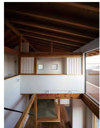
リビング上部の吹抜を介して、家族の気配を感じる。