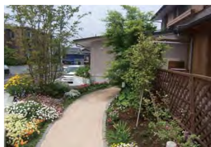
アプローチは三和土でつくった緑の小道。

「お邪魔します」と玄関に入る。左手に診療所の機能を満たす待合室、診察室、相談室、X線室が設けられている。右側の大きな扉の向こうは、杉の板と土や和紙の自然素材でおおわれた素朴でのびやかな居間空間。通常はデイホスピスの場として、また家族の集いや音楽会、レクチャー