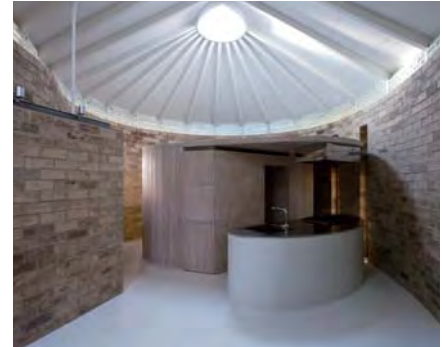
密度をキーワードに素材を選定した