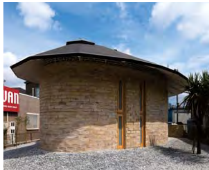
手作りの土ブロックは様々な風合いをもつ