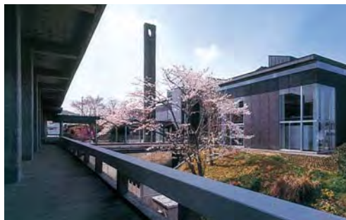
既存棟バルコニーから増築棟を見る