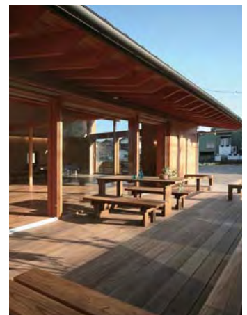
深い軒とデッキスペースが中間領域となって家の内と外をあいまいにつないでいる。