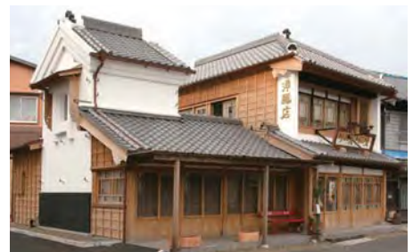
空家を新たな所有者が店舗併用住宅として修理しスパゲッティ店として生まれ変わった。