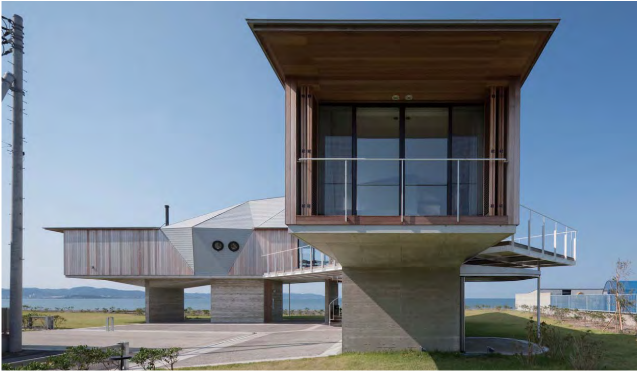
建物を抜けて感じ取れる館山の海(東側外観)