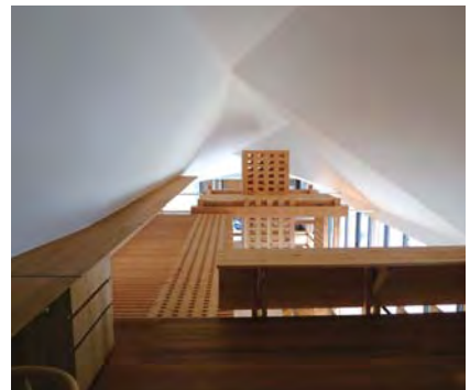
ロフトからキッチン、ダイニング、リビングを見通す