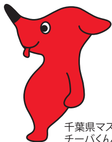
千葉県マスコットキャラクター チーパくん