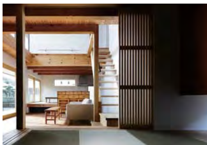
小上がりの客間(将来母親寝室)は、格子建具で仕切る。