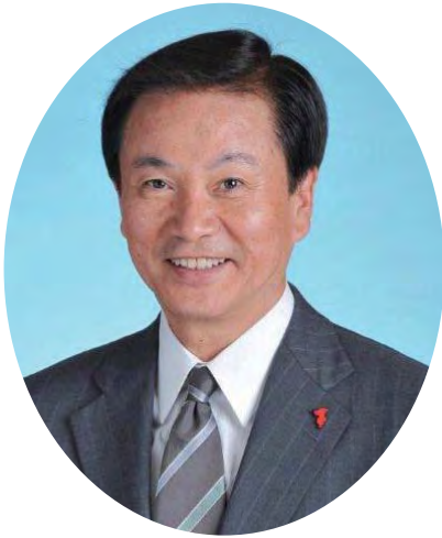
千葉県知事 森田 健作

平成24年度の千葉県建築文化賞に多くの皆様から御応募をいただき、誠にありがとうございました。