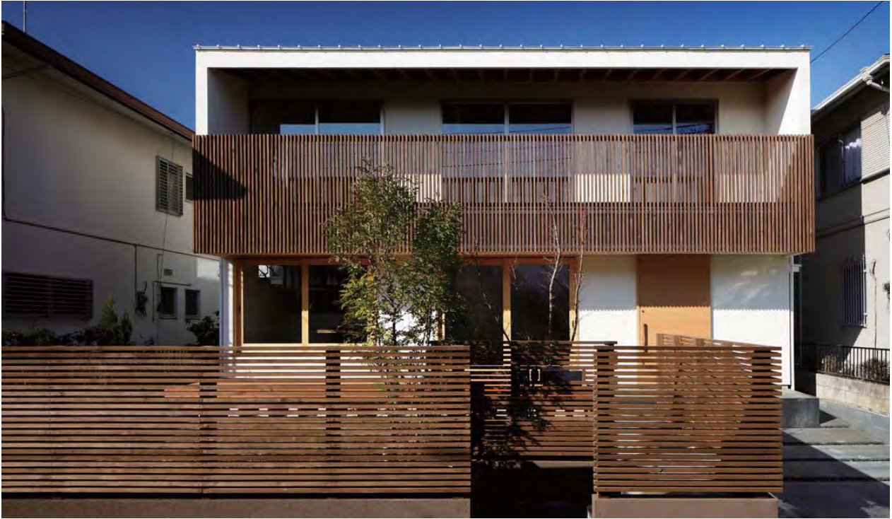
南側外観 木製格子が繊細な表情をつくる。国産材を積極的に使用。

流山市の南部に位置する敷地は、1970年代に区画整理・分譲された土地である。建替えが進む中でひととき存在感のある『木格子の塀とバルコニー』を持つ『南流山の家』である。南側道路に面した庭と2階のバルコニーからは陽が入り、一日中明るい開放感のある住まいである。