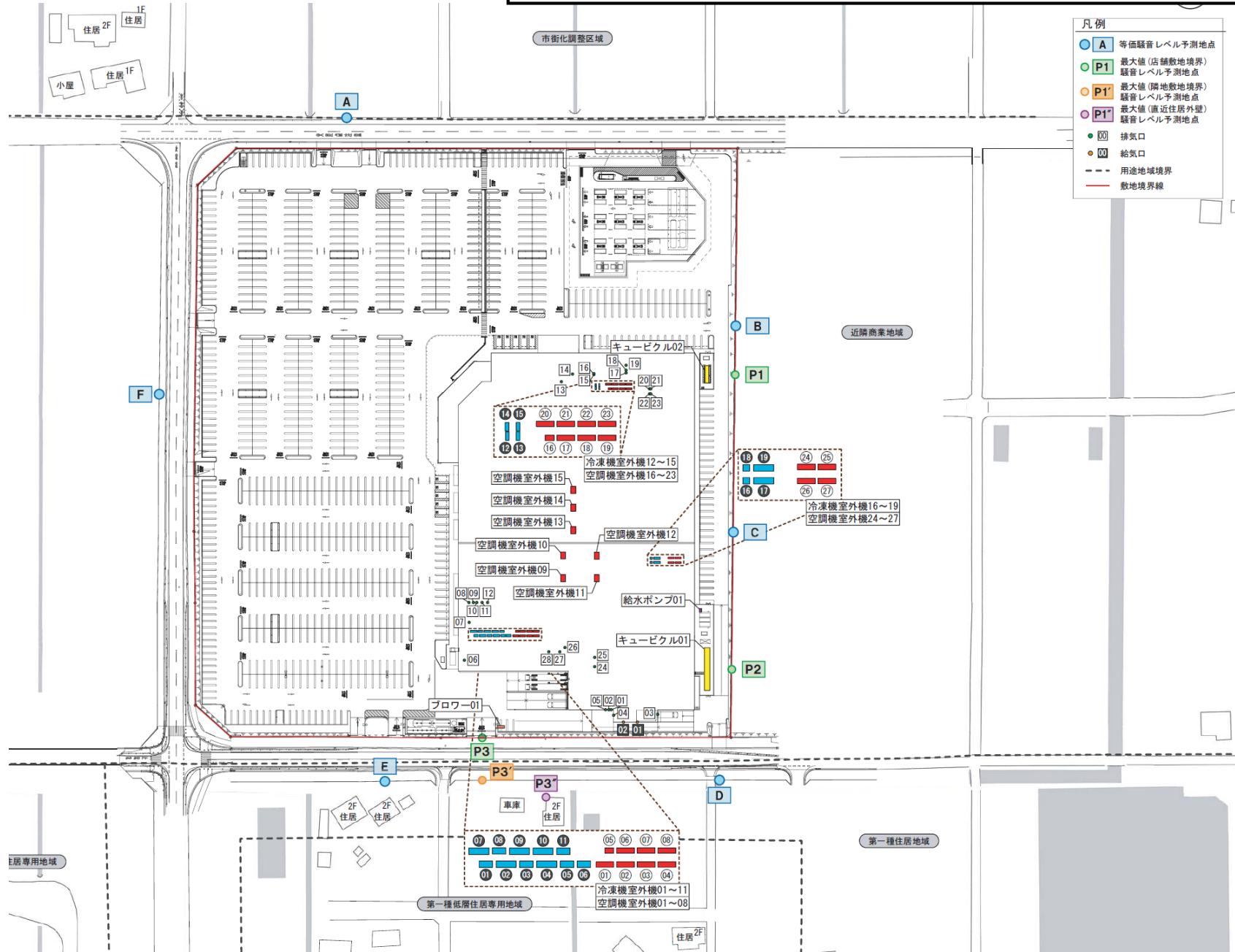
図5 騒音発生予測地点及び発生源位置図