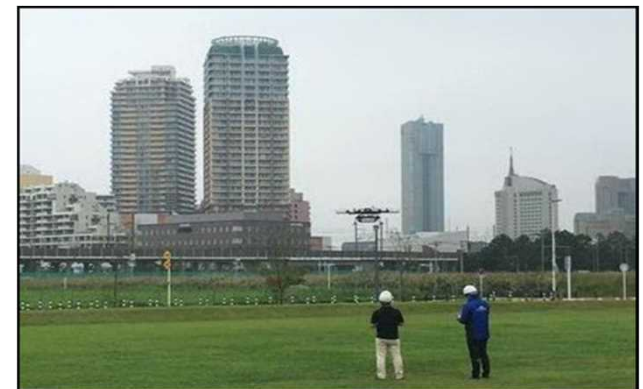
※国家戦略特区制度を活用したドローン宅配等実証実験の様子