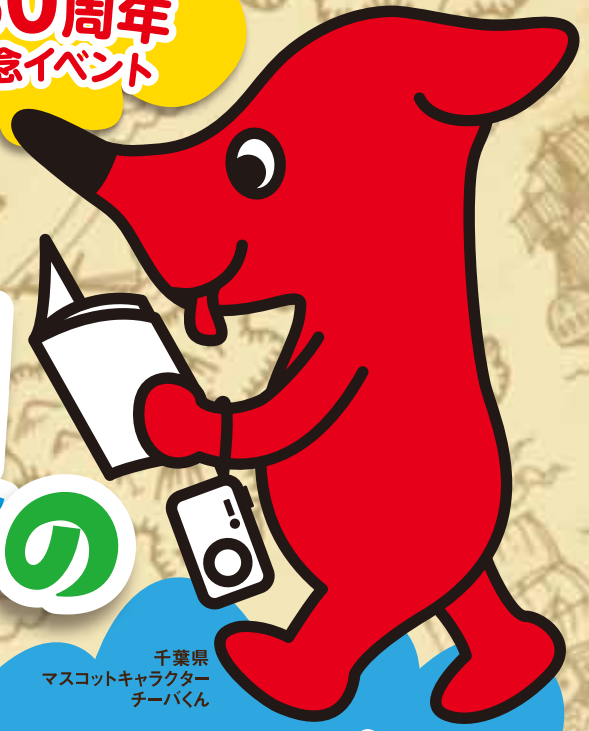
千葉県 マスコットキャラクター チーバくん

期間 6月15日(木) 令和5年 ~ 9月24日(日) 応募期間: 令和5年6月15日(木)~10月1日(日)