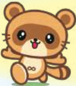
木更津市マスコットキャラクター きさポン