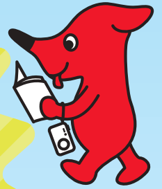
千葉県 マスコットキャラクター チーバくん