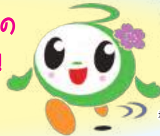
富津市おもてなしキャラクター ふつつん