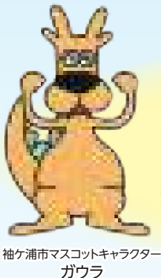
袖ヶ浦市マスコットキャラクター ガウラ