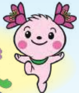
君津市マスコットキャラクター さみびよん