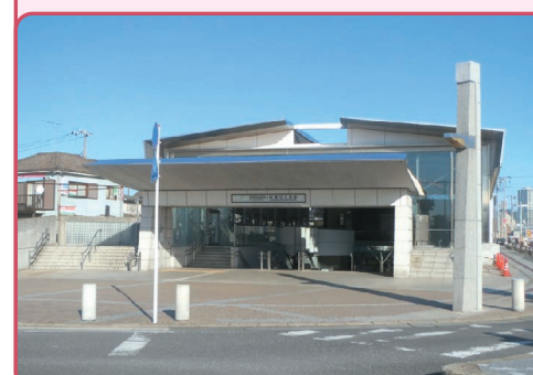
船橋日大前駅西口