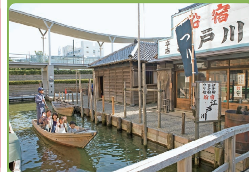
浦安市郷土博物館