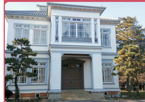
きゆうこぼけんしよ 空挺館(旧御馬見所)