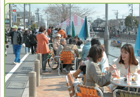
カフェテラスin境川