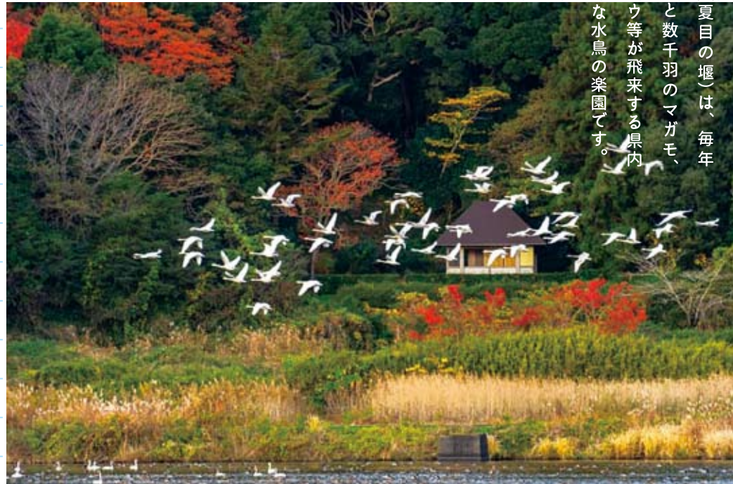
23 東庄町賞「白鳥舞う里の秋」