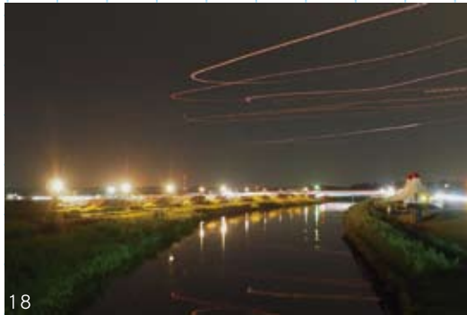
栗山川 / あじさい遊歩道