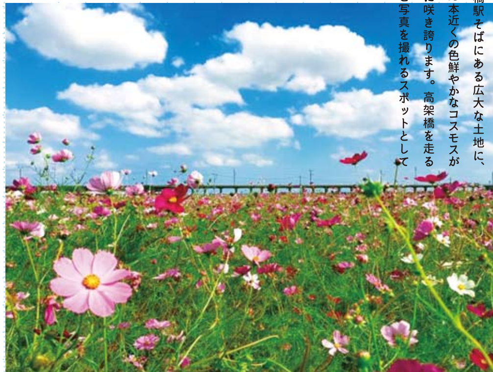
02 香取市賞「秋晴れにコスモス微笑む」 #与田浦コスモスまつり #2021年10月撮影

十二橋駅そばにある広大な土地に、 三百万本近くの鮮やかなコスモスが 一面に咲き誇ります。高架橋を走る 電車と写真を撮れるスポットとして 人気。