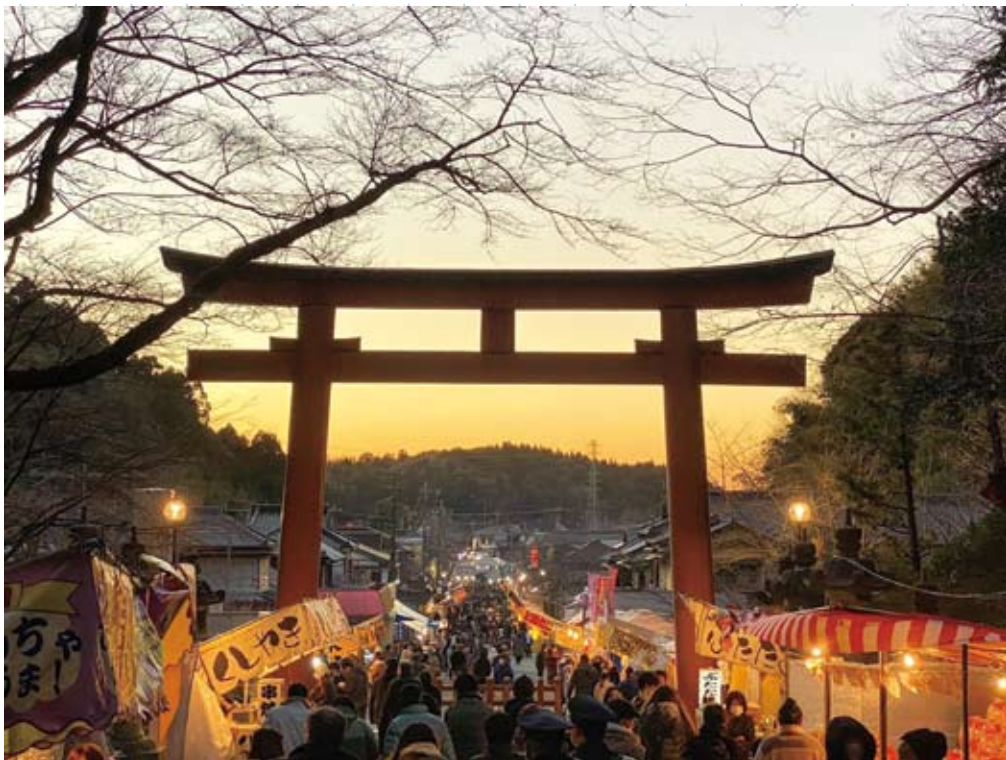
01 香取市賞「新年祈願の帰り道」 #香取神宮 #2022年1月撮影