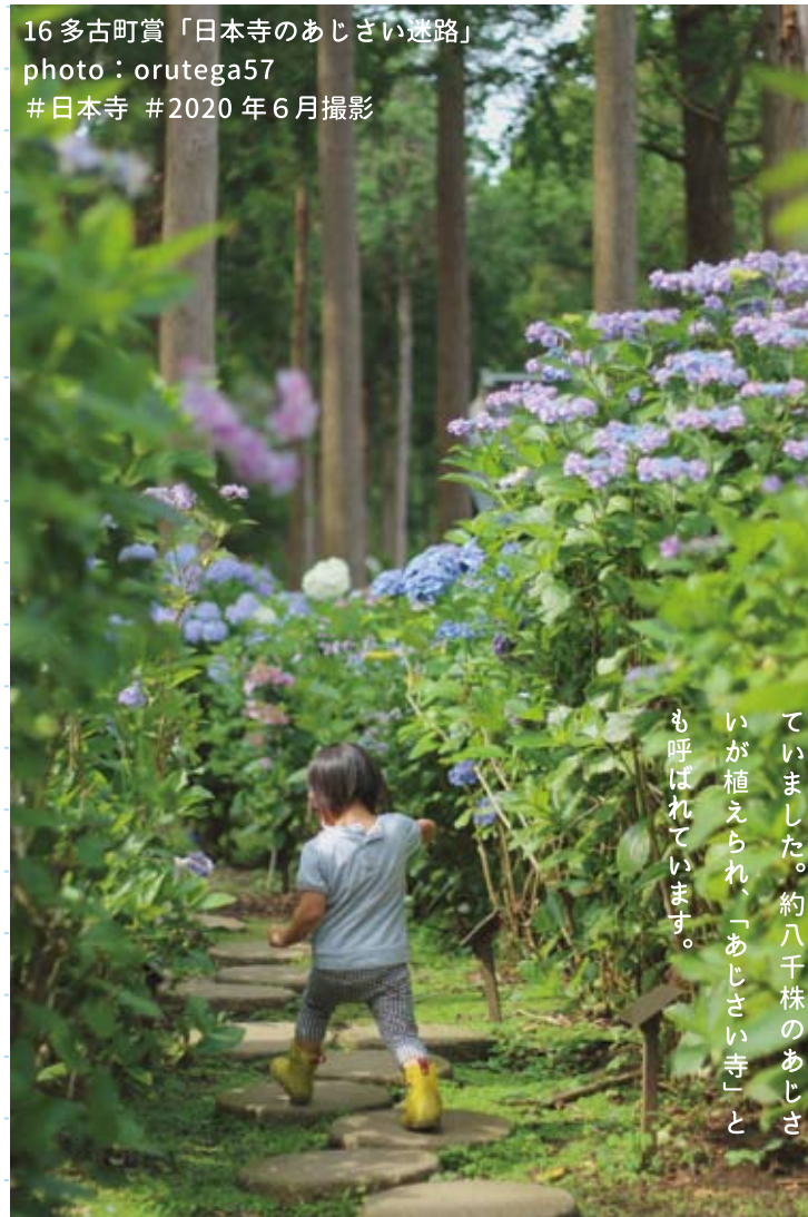
16 多古町賞「日本寺のあじさい迷路」 #日本寺 #2020年6月撮影

日蓮宗の本山寺院で、日本中から 学僧が集まる中村檀林が開かれ ていました。約八千株のあじさ いが植えられ、「あじさい寺」と も呼ばれています。