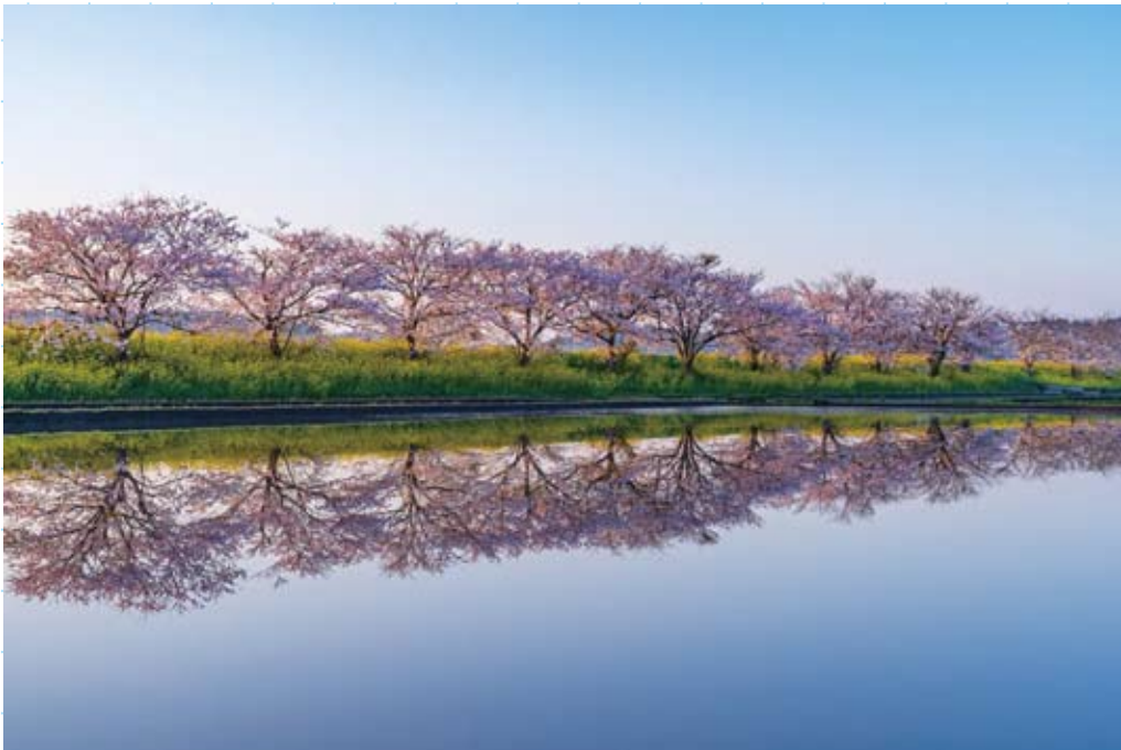
15 多古町賞「春を映す水田」 #多古町大島城跡付近の栗山川沿い #2022年4月撮影