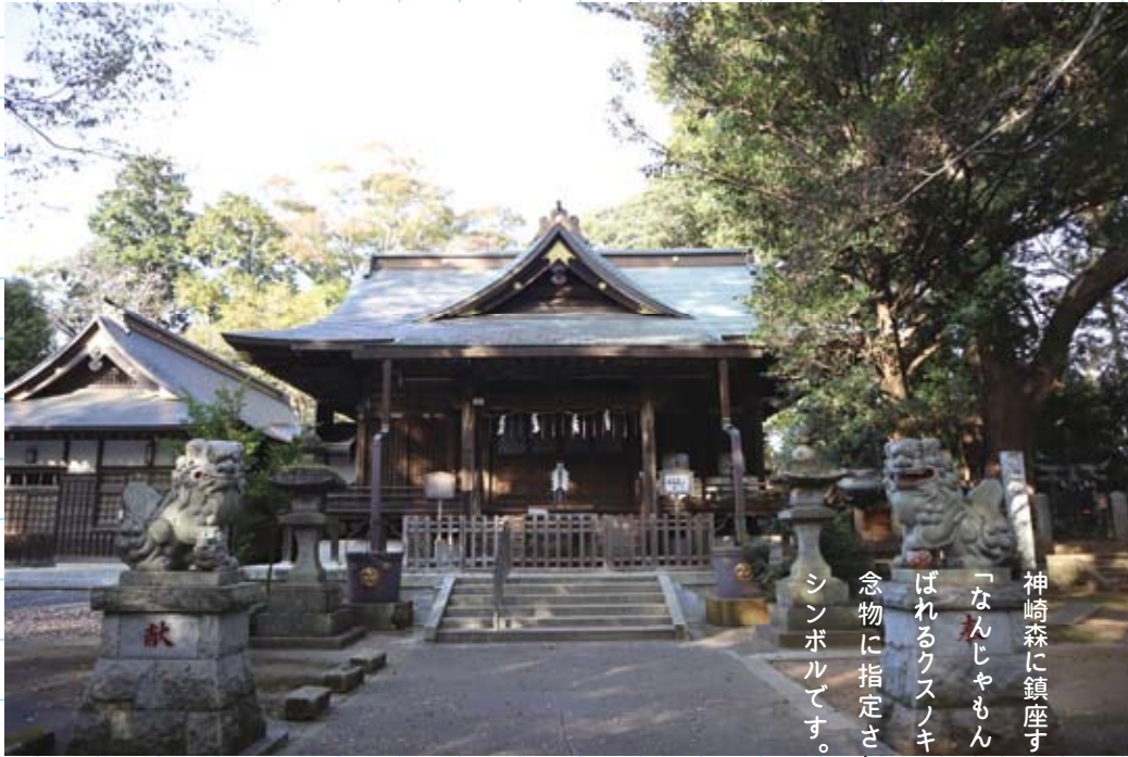
08 神崎町賞「空の神が鎮座する森」 #神崎神社 #2022年11月撮影

神崎森に鎮座する神社。境内の「なんじゃもんじゃの木」と呼ばれるクスノキは、国の天然記念物に指定されており、町のシンボルです。