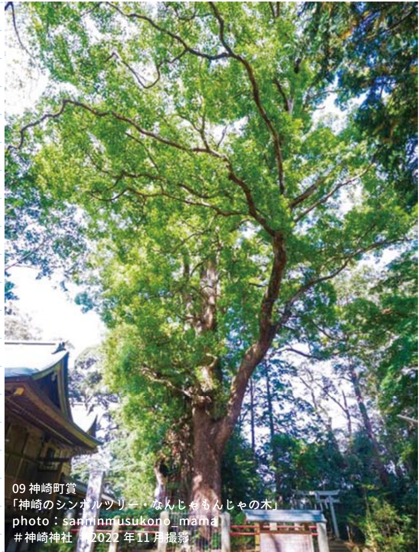
09 神崎町賞 「神崎のシンボルツリー・なんじゃもんじゃの木」 #神崎神社 #2022年11月撮影

神崎森に鎮座する神社。境内の「なんじゃもんじゃの木」と呼ばれるクスノキは、国の天然記念物に指定されており、町のシンボルです。