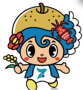
いすみ市マスコットキャラクター いすみん