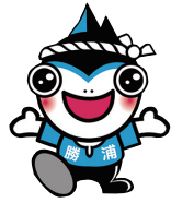
勝浦市マスコットキャラクター 勝浦カッピー