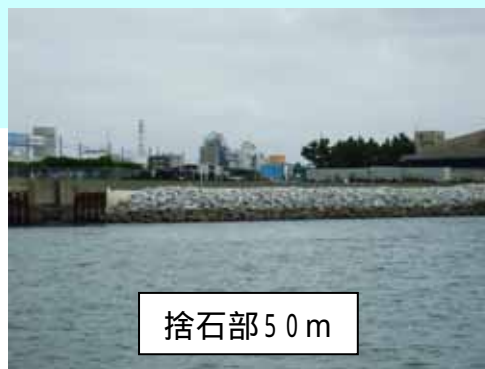
捨石部 50 m