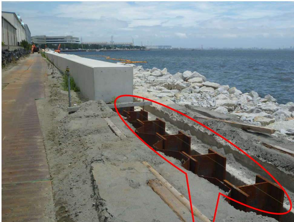
《陸側H鋼杭の設置状況》