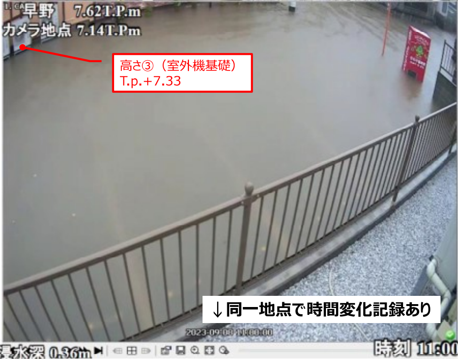
防犯カメラ撮影時刻と推定浸水位