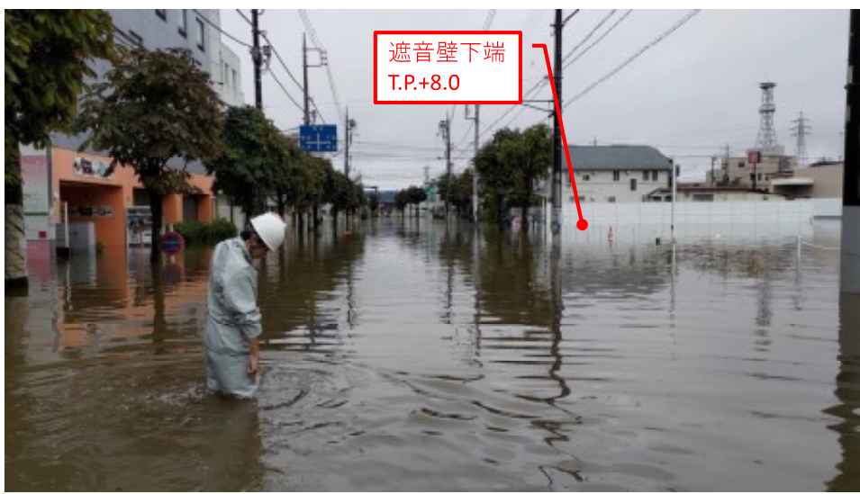
水防活動時の撮影時間と推定浸水位