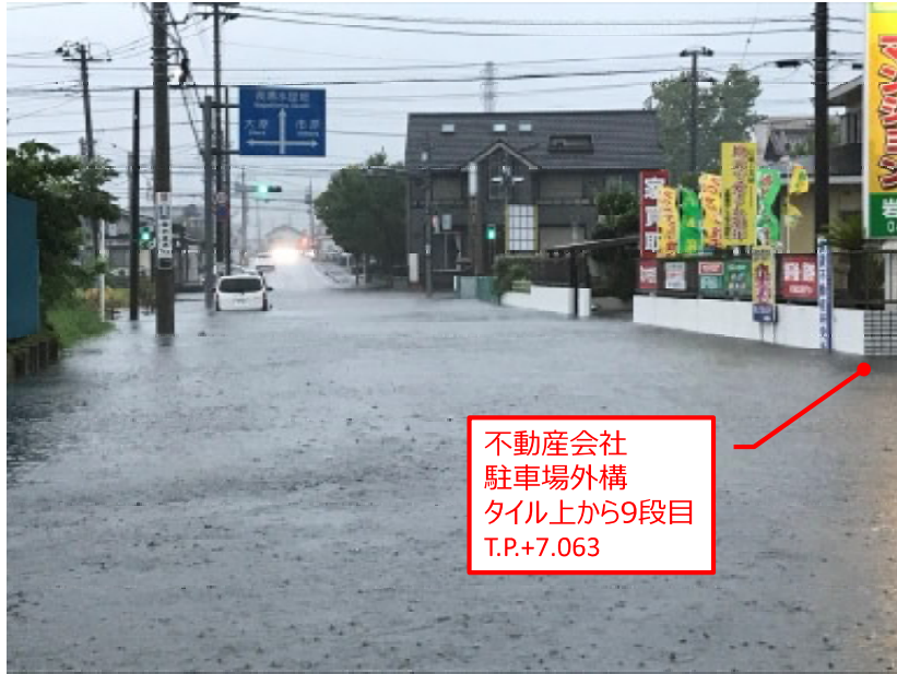
10:30ころ 千葉銀から八千代一丁目交差点