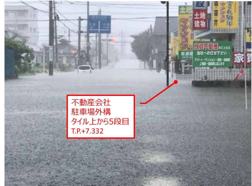
11:30ころ 千葉銀から八千代一丁目交差点