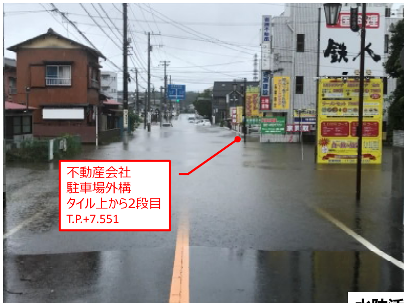
12:20ころ 千葉銀から八千代一丁目交差点