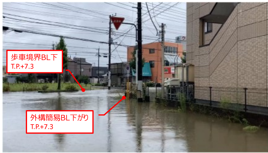
氾濫記録動画の撮影時間と推定浸水位