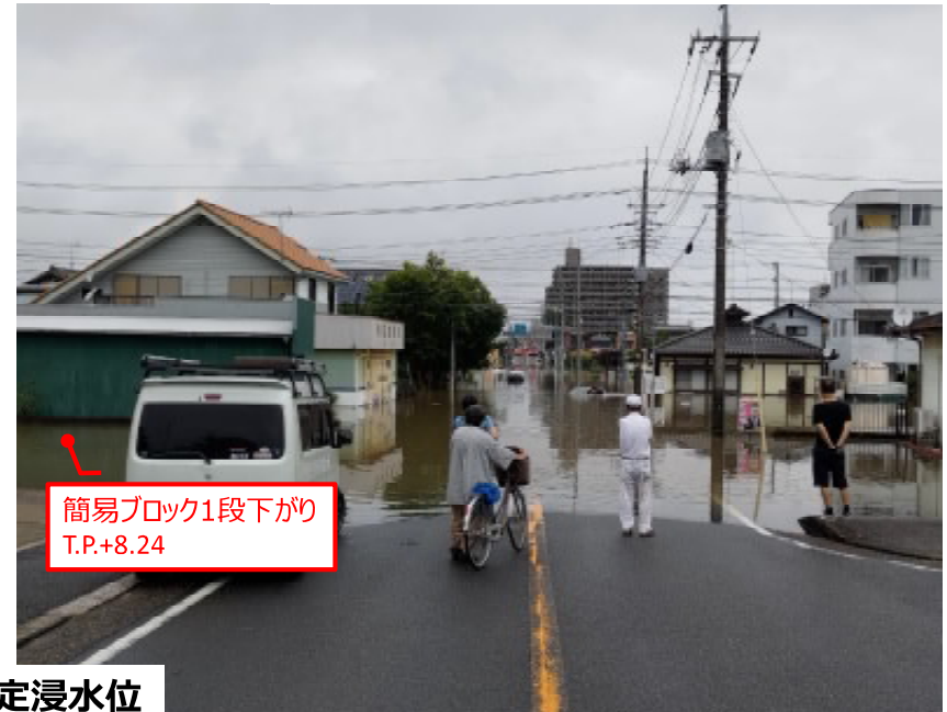
15:29 八千代橋から八千代一丁目交差点