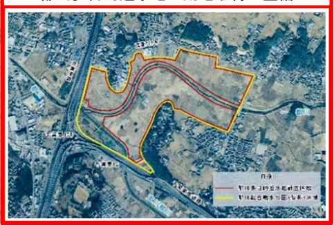
都川多目的遊水地の用地取得・整備