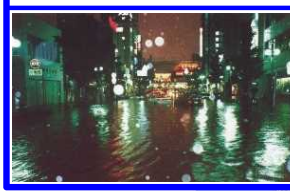
【平成8年】大草橋付近