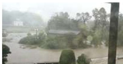
【平成25年】岡田橋付近浸水状況