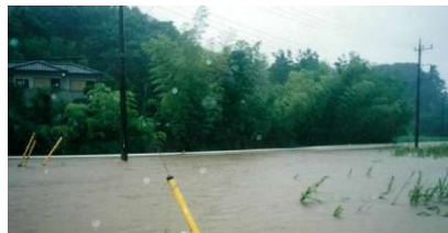
【平成12年】岡田橋付近浸水状況