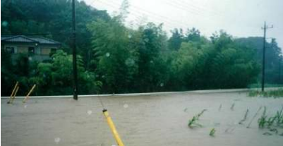
【平成12年】岡田橋付近浸水状況