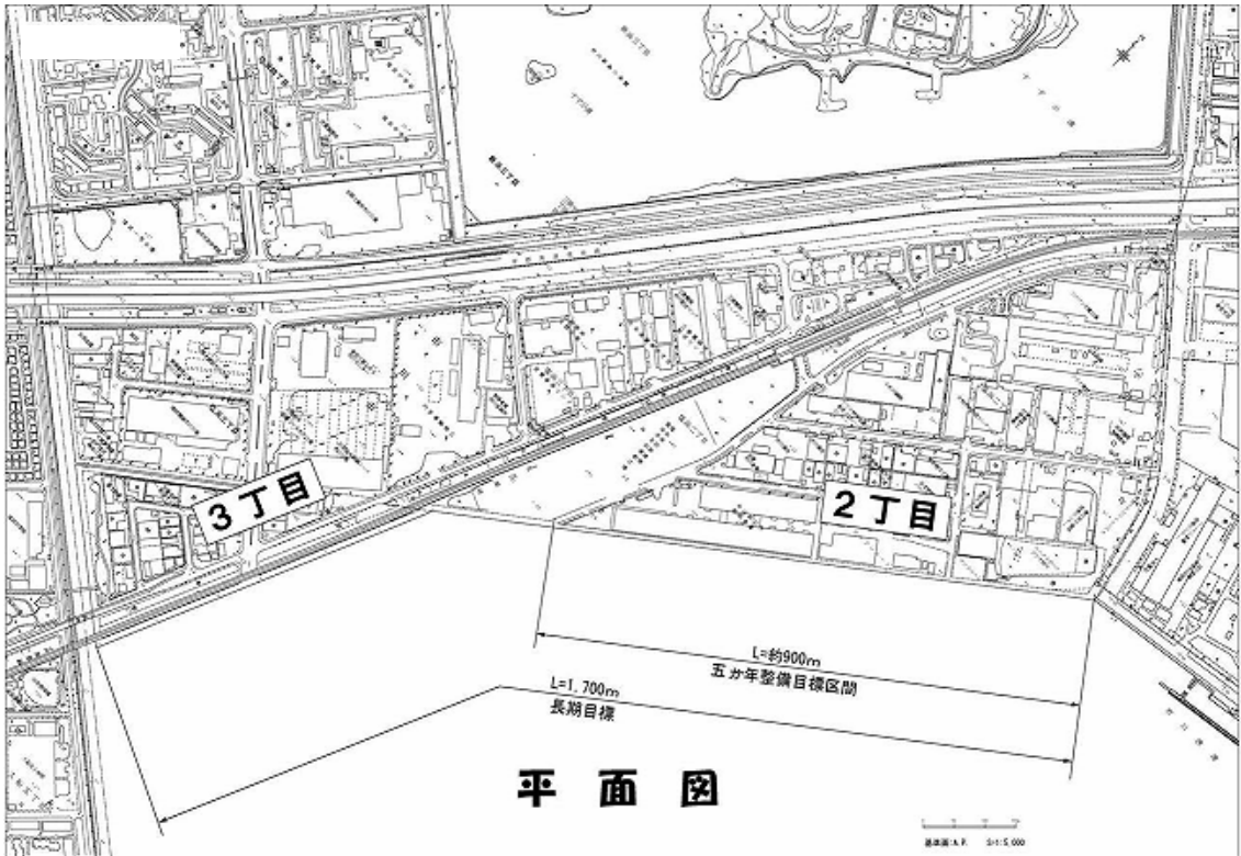
図 2 - 5 - 1 市川市塩浜護岸位置図