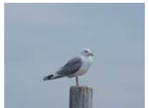
セグロカモメ 冬鳥 主に10月～4月に観察されている。5月に観察されている。