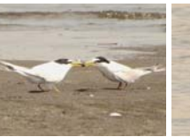
コアジサシ 夏鳥 主に4月～8月に観察されている。