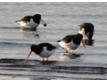
ミヤコドリ 旅鳥または冬鳥 主に10月～4月に確認されている。