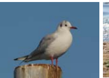
ユリカモメ 冬鳥 主に10月～5月に観察されている。