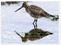
オオソリハシシギ 旅鳥 主に4月～5月、8月～10月に観察されている。