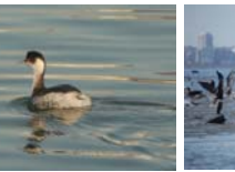
ハジロカイツブリ 冬鳥 主に11月～4月に観察されている。