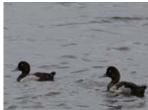
スズガモ 冬鳥 主に10月～4月に観察されている。