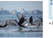
カワウ 留鳥 周年みられる。