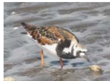
キョウジョシギ 旅鳥。主に4月～9月に観察されている。