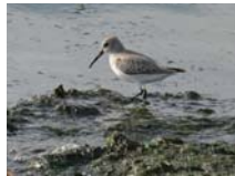
ハマシギ 旅鳥または冬鳥 主に9月～5月に観察されている。