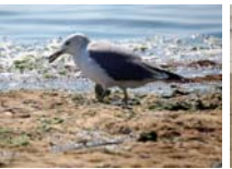
ウミネコ 留鳥 主に8月～9月に多く観察されている。