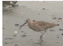
チュウシャクシギ旅鳥 主に4月～5月に観察されている。