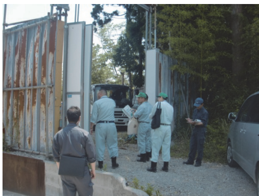
写真3 ヤードへの立入りの様子(1)