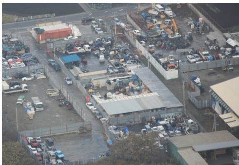
写真1 ヤードのイメージ