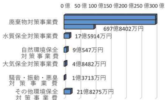
図表 6-5-6 市町村における主な事業別予算

市町村では財政のひっ迫した状況の中で、多様化する環境問題に対応すべく、環境保全対策予算の確保に努めています。(図表 6-5-6)