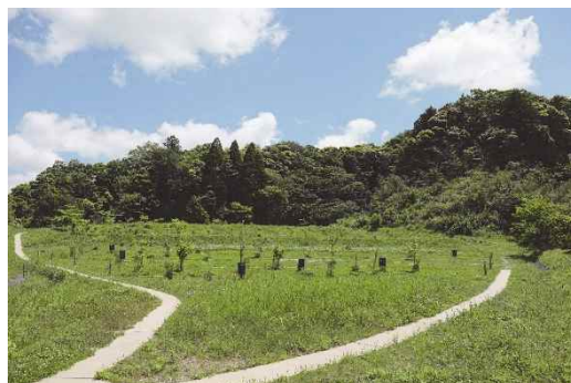
体験の機会の場（森の墓苑、長南町）

民間の土地・建物の所有者等が提供する自然体験活動などの場について、都道府県知事等が認定する「環境教育等による環境保全の取組の促進に関する法律（環境教育等促進法）」に基づく「体験の機会の場」認定制度の周知を図り、2020年4月1日に県内初となる認定を行いました。