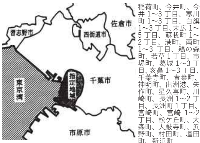
図表 6-5-2 補償法による指定地域(旧第一種地域)