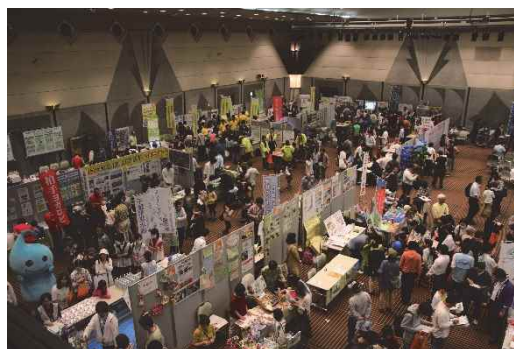
エコメッセ2019 in ちば

2019年度に開催した「エコメッセ2019 in ちば」では、113の出展団体のもと、10,500人が来場し、環境保全に取り組む多様な立場の人々の交流、情報交換の機会を提供しました。