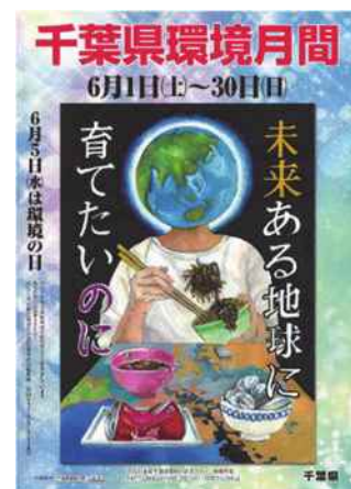
千葉県環境月間ポスター

2019年度は、「エコメッセ2019in ちば」でトークショーを実施したほか、幕張の浜での清掃活動を行いました。