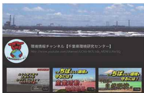
環境情報チャンネル

県民が環境学習に関する情報をいつでも入手できるように、環境学習プログラム・教材等を県ホームページで公開しているほか、YouTube（環境情報チャンネル）において「産業活動と環境問題」や「千葉県の自然環境」などをテーマにした環境学習動画の配信を行いました。