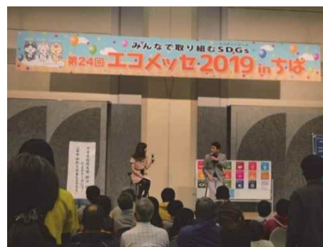
千葉県環境大使による活動