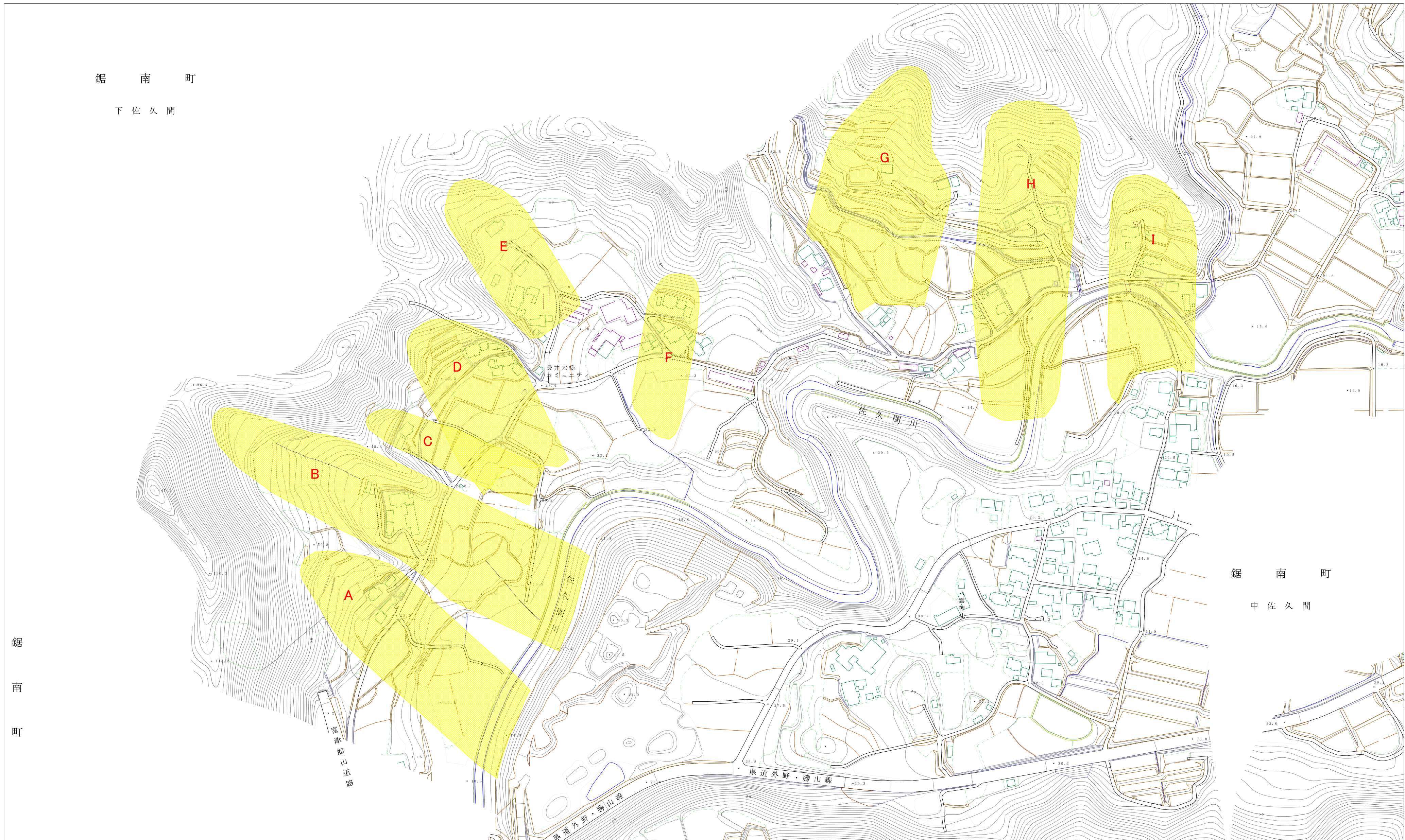
様式-2(地) 土砂災害警戒区域・土砂災害特別警戒区域 区域図