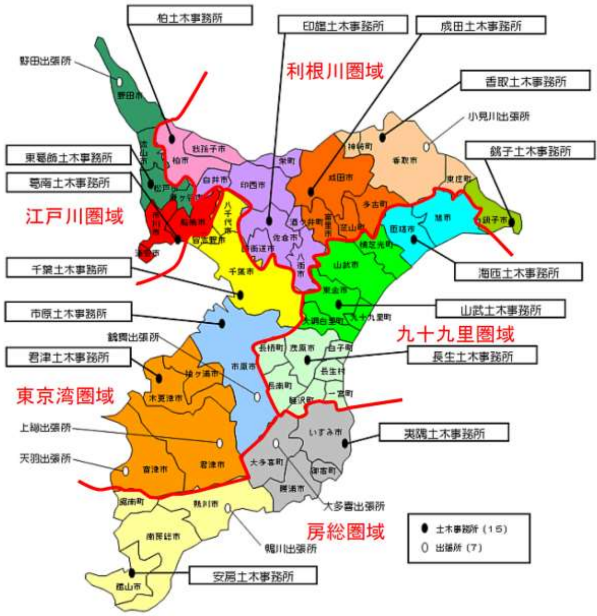
別図1 (千葉県分割図)