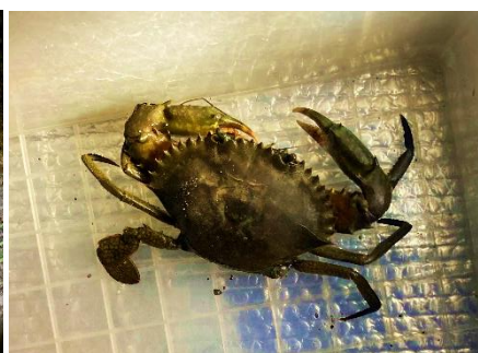
採捕されたがざみ類