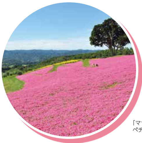
「マザー牧場」(富津市)の桃色の ペチュニアは6月～9月頃が見ごろ

圏央道開通効果を取り込み、 多彩な産業展開により本県経済の けん引軸の形成にチャレンジする地域