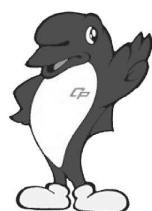
千葉県警察マスコットキャラクター シーポック