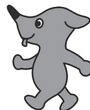
千葉県マスコットキャラクター 「チーパくん」